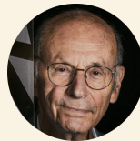
Boris Cyrulnik parrain de la conférence

Alors, bienvenue à celles et ceux qui sont prêts à réfléchir, à débattre et à construire. Campus 45 est le lieu de cette réflexion.